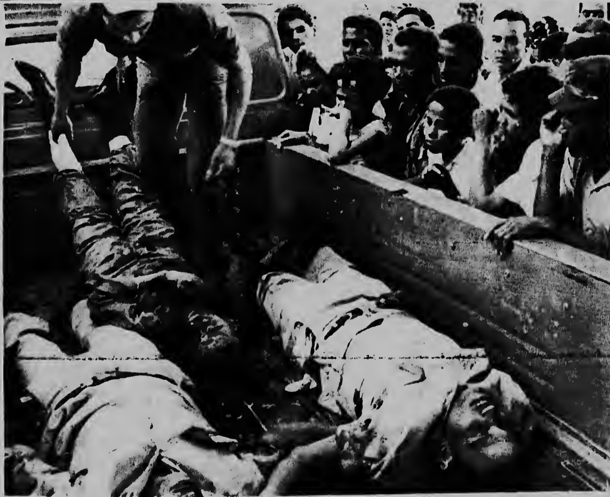
SANTIAGO, REPUBLICA DOMINICANA -- Cadavernan di soldanan dominicano, cu a ser mata durante batallanan entre rebeldenan y gobierno ta ser pone den un truck. Mas o menos 26 persona a ser mata durante e ultimo cuater dianan aki na Santo Domingo, Radiophoto UPI.

Den un otro artículo cu a ser distribuí pa e agencia "Nueva China", Pekin ta declara cu e reciente sugerencia cu a ser hasi pa Merca di cu nan lo permiti forsan norteamericano persigui guerrilleronan comunista te hasta den territorio di Camboya, ora cu nan kler refugia elnan, no ta mas "cu un pretexto di Merca pa amplia eguer-ra".